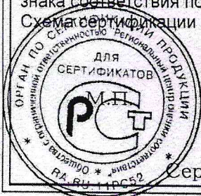
Схема сертификации 7.

Место нанесения знака соответствия – в товаросопроводительной документации, графическое изображение знака соответствия по ГОСТ Р 50460-92 с надписью «Добровольная сертификация».